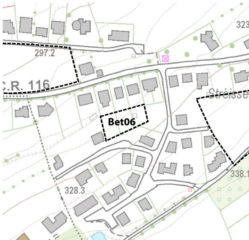
Carte topographique (ACT,2017)