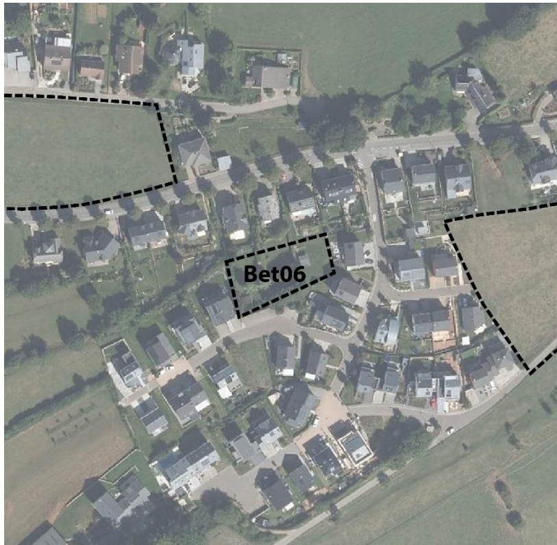
Orthophotoplan 2019 (ACT,2019)